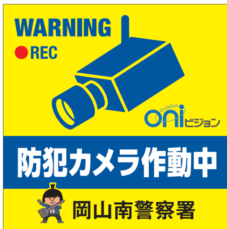
防犯カメラサービスのステッカー